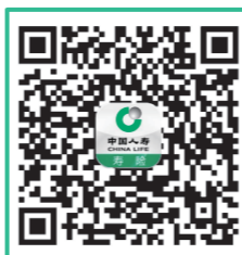
中国人寿寿险APP下载

学生家长可将保险理赔资料交至保险公司各营业网点或将保险理赔资料交至学校保险服务窗口。保险公司各营业网点信息可关注官方微信公众号“中国人寿股份上海市分公司服务号”,在“产品中心”-“学生平安保险”专栏中查询。